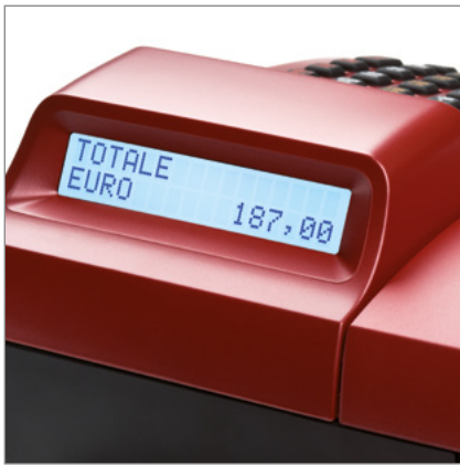
Display cliente a doppia riga retroilluminato