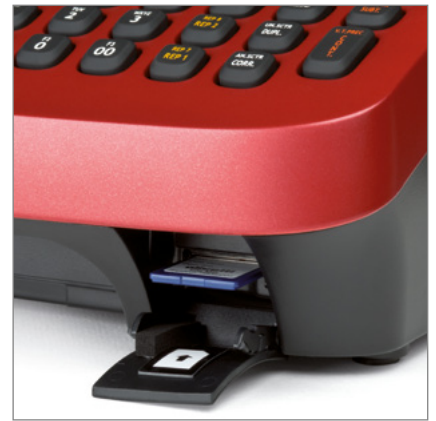
Giornale di fondo elettronico per l'archiviazione dei dati fiscali di vendita