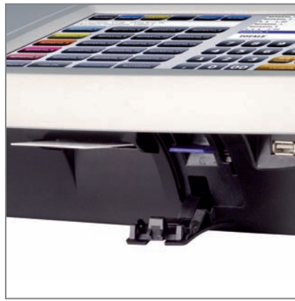
GIORNALE DI FONDO ELETTRONICO, USB MASTER E LETTORE CHIP CARD INTEGRATO