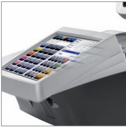
TOUCH SCREEN con inclinazione regolabile